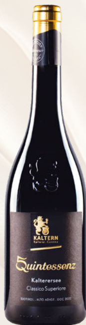
Quintessenz A.A. Kalterersee Classico Superiore DOC Schiava