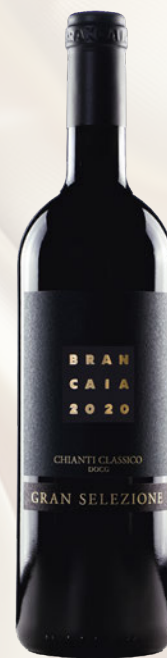
Chianti Classico DOCG Gran Selezione Sangiovese Bio