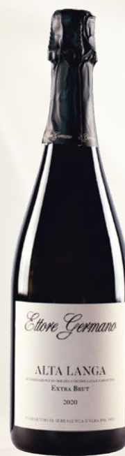
Alta Langa DOCG Extra Brut