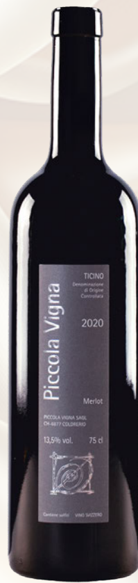
Ticino DOC Merlot Barrique