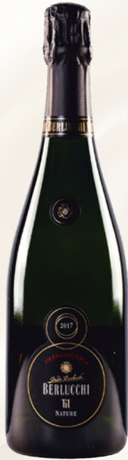
'61 Nature Franciacorta DOCG Chardonnay, Pinot Nero