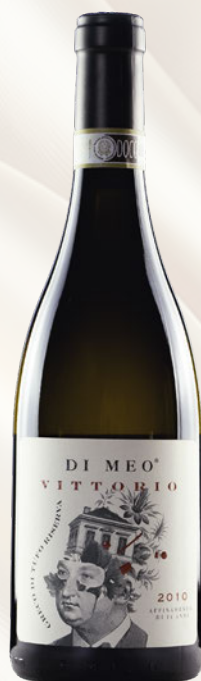
Vittorio Greco di Tufo DOCG