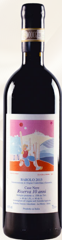
Case Nere Barolo DOCG Riserva 10 anni