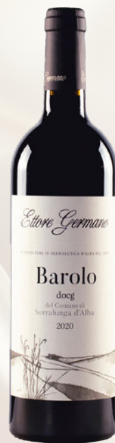
Barolo DOCG del comune di Serralunga d'Alba