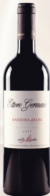
Della Madre Barbera d'Alba DOC Superiore