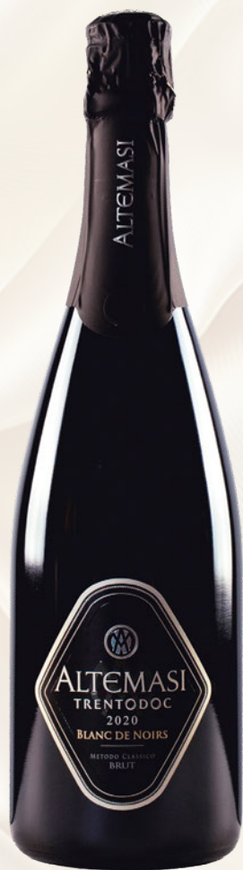
Altemasi Blanc de Noirs Brut Trento DOC Pinot Nero