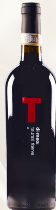
Taurasi Riserva DOC