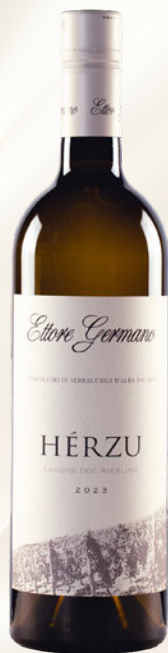
Herzu Langhe DOC Riesling