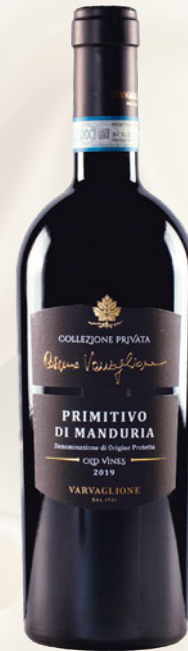
Cosimo Varvaglione Collezione Privata Primitivo di Manduria Salento DOP