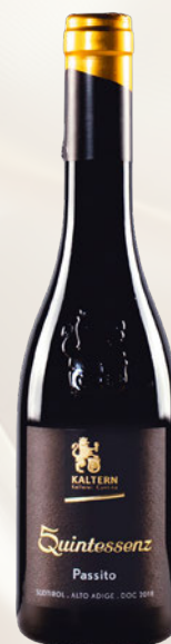
Quintessenz Moscato Giallo Passito Alto Adige DOC