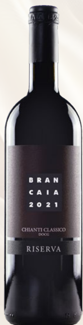
Chianti Classico Riserva DOCG Sangiovese Bio