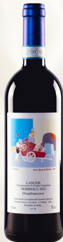
Disanfrancesco Langhe Superiore DOC