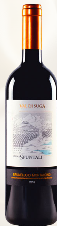
Vigna Spuntali Brunello di Montalcino DOCG Sangiovese Grosso