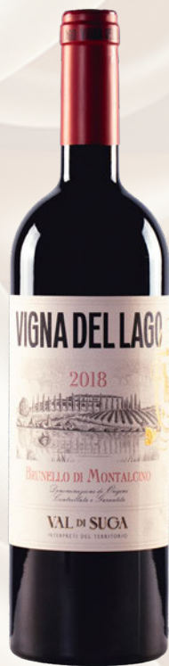
Vigna del Lago Brunello di Montalcino DOCG Sangiovese Grosso