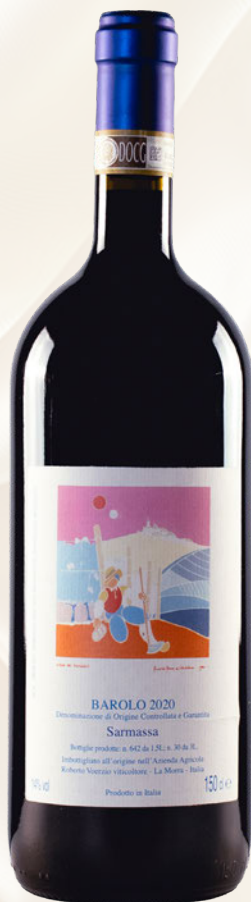
Sarmassa Barolo 1,5 l DOCG