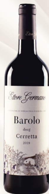
Cerretta Barolo DOCG