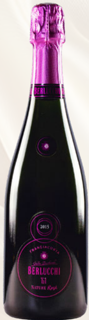
'61 Nature Rosé DOCG Pinot Nero