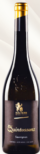
Quintessenz Sauvignon Alto Adige DOC