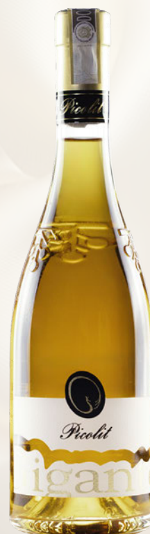
Picolit Colli Orientali del Friuli DOC