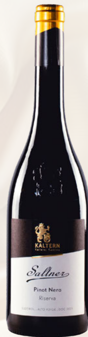
Saltner Pinot Nero Alto Adige DOC Riserva