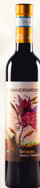
Serapias Passito di Pantelleria DOC Zibibbo