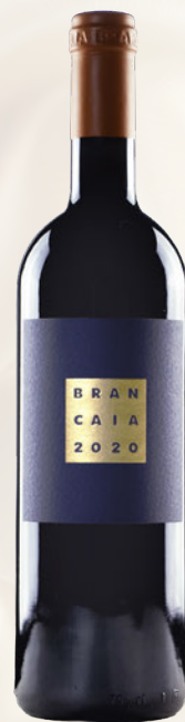
Il Blu Rosso Toscana IGT Merlot, Sangiovese, Cabernet Sauvignon Bio