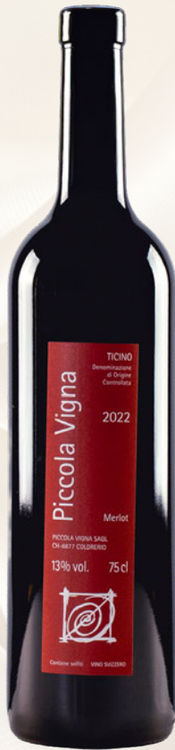
Ticino DOC Merlot