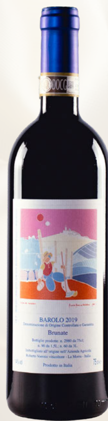
Brunate Barolo DOCG