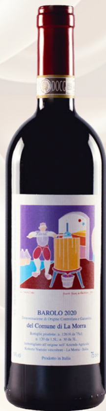
Barolo DOCG del comune di La Morra