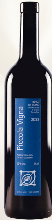
Rosso del Ticino DOC Merlot, Gamaret, Cabernet Sauvignon