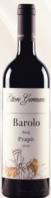
Prapò Barolo DOCG