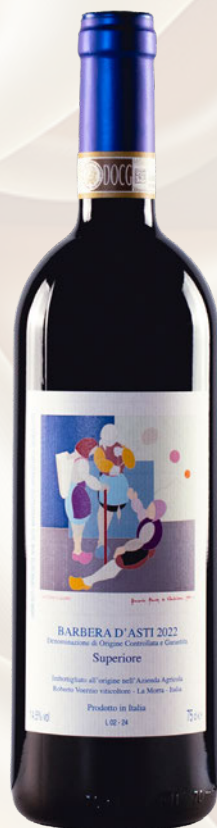
Barbera d'Asti Superiore DOC