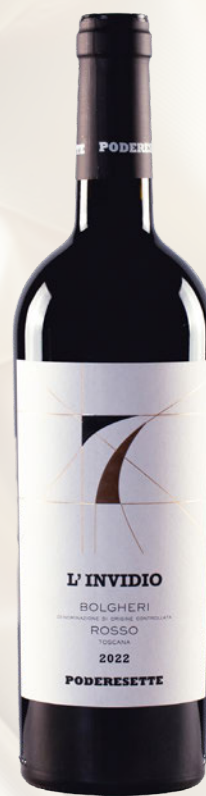
L'Invidio Bolgheri Rosso DOC Merlot Cabernet Franc, Cabernet Sauvignon