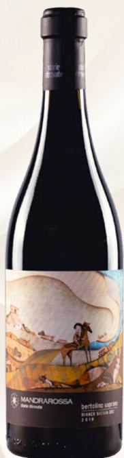
Bertolino Soprano Bianco Sicilia DOC Grillo