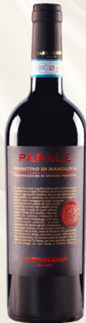
Papale Primitivo di Manduria DOP