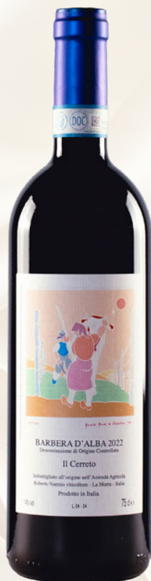
Il Cerreto Barbera d'Alba DOC