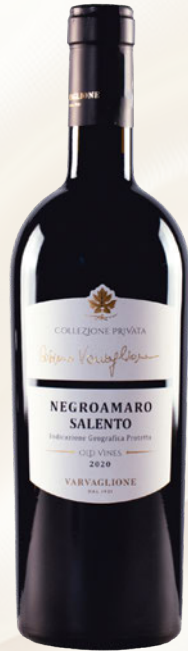
Cosimo Varvaglione Collezione Privata Negroamaro Salento IGP