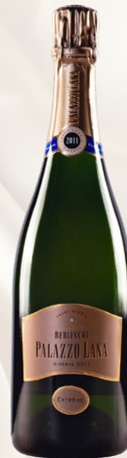
Palazzo Lana Extreme Franciacorta DOCG Riserva Pinot Nero