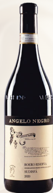
Sudisfà Roero DOCG Riserva Nebbiolo