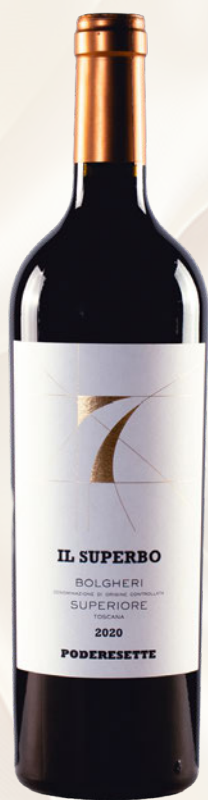
Il Superbo Bolgheri Superiore DOC Cabernet Franc, Cabernet Sauvignon