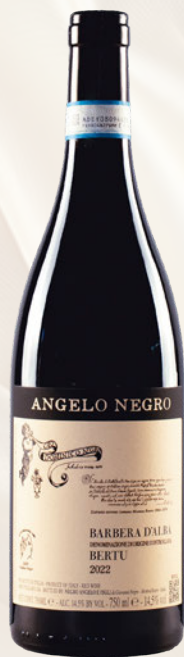
Bertu Barbera d'Alba DOC