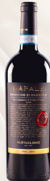
Papale Oro Primitivo di Manduria DOP