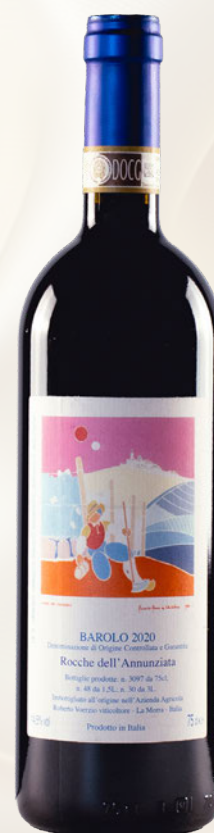
Rocche dell'Annunziata Barolo DOCG