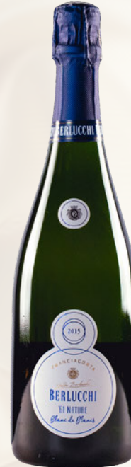
'61 Nature Blanc de Blancs DOCG Chardonnay