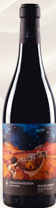
Terre del Sommacco Rosso Sicilia DOC Nero D'Avola