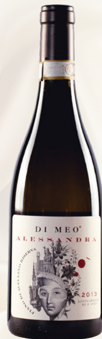
Alessandra Fiano di Avellino DOCG