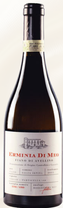
Erminia Di Meo Fiano di Avellino DOCG