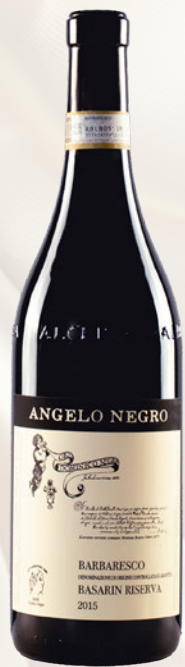
Basarin Barbaresco DOCG Riserva