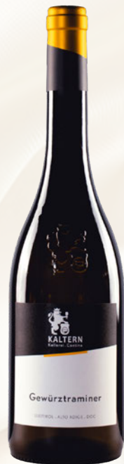
Campaner Gewürztraminer Alto Adige DOC