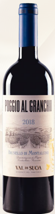
Poggio al Granchio Brunello di Montalcino DOCG Sangiovese Grosso