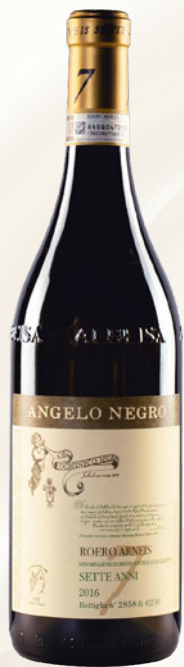
7 anni Roero Arneis DOCG