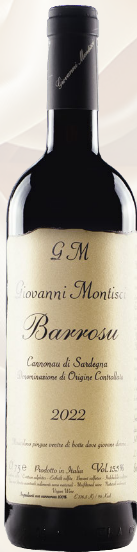
Barroso Cannonau di Sardegna DOC