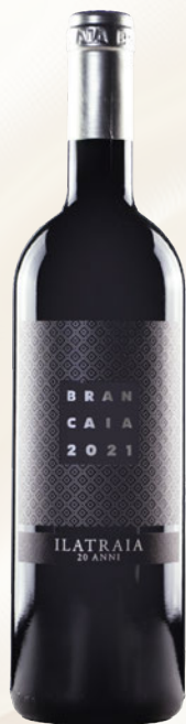
Ilatraia Rosso Toscana IGT Petit Verdot, Cabernet Sauvignon, Cabernet Franc Bio