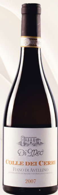
Colli dei Cerri Fiano di Avellino DOCG