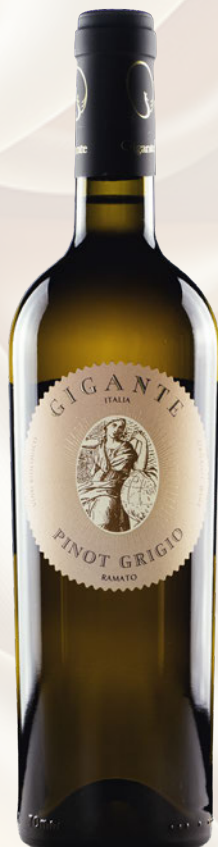
Pinot Grigio Colli Orientali del Friuli DOC Bio