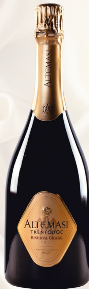
Altemasi Riserva Graal Trento DOC Pinot Nero, Chardonnay