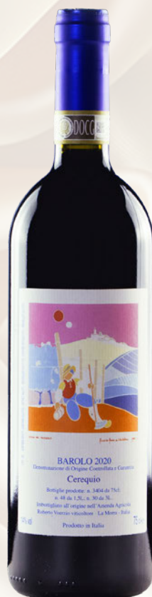
Il Cerequio Barolo DOCG