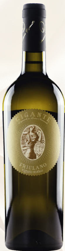
Vigneto Storico Friulano Colli Orientali del Friuli DOC